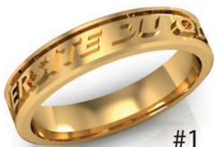
#1 V G 20