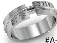
#A-28 G 44