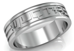
#51 ▼ G 44