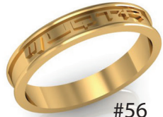
#56 V G 44