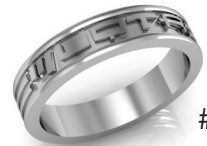
#52 V G 44