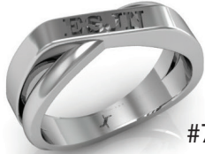
#70 G 4