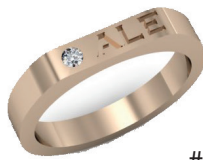
#11 G 4