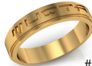
#54 V G 44