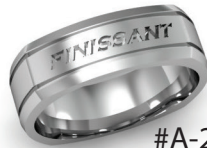
#A-22 G 10