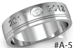
#A-5 ▼ G 44