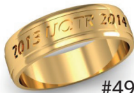
#49 ▼ G 444