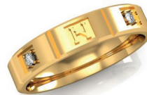
#73 V G 44