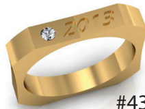
#43 G 44