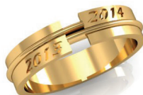
#27 G 44