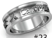
#23 V G 20