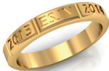
#47 V G 44