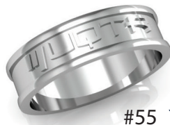
#55 ▼ G 44