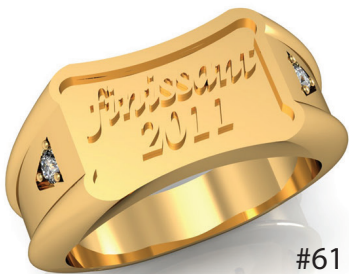
#61 ▼ G 88