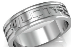
#A-51 ▼ G 6