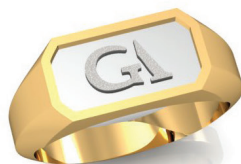
#58 ▼ G 44