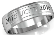
#A-49 ▼ G 444