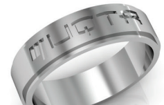
#A-53 ▼ G 44