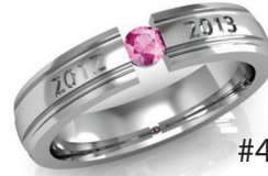
#4 G 44