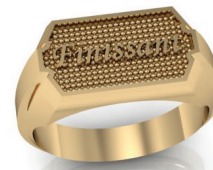
#62 ▼ G 88