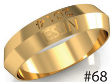
#68 G 44