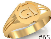
#65 ▼ G 44