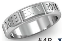
#48 ▼ G 44