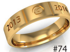
#74 ▼ G 44