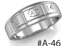
#A-46 ▼ G 44