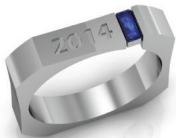
#42 G 4