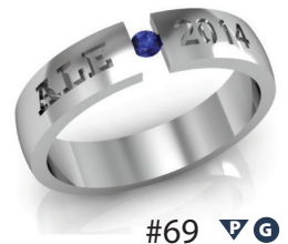
#69 ▼ G 44