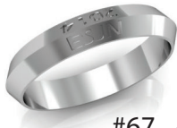
#67 G 44