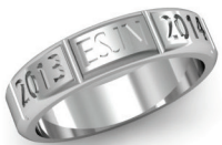
#A-48 ▼ G 444