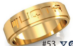
#53 ▼ G 44